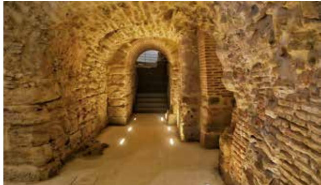
· Museo Arqueológico ·

El museo se ubica en la parte superior del Conjunto Arqueológico romano, que está integrado principalmente por una serie de construcciones hidráulicas que datan del siglo I d. C., criptopórticos, restos de viviendas romanas y hornos islámicos.