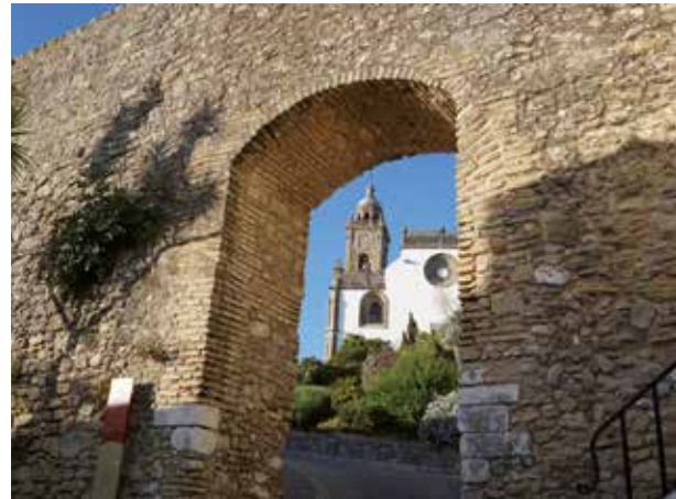
· Arco de Belén ·

Cruzamos el arco de Belén para subir hasta los restos de la Villa Vieja.