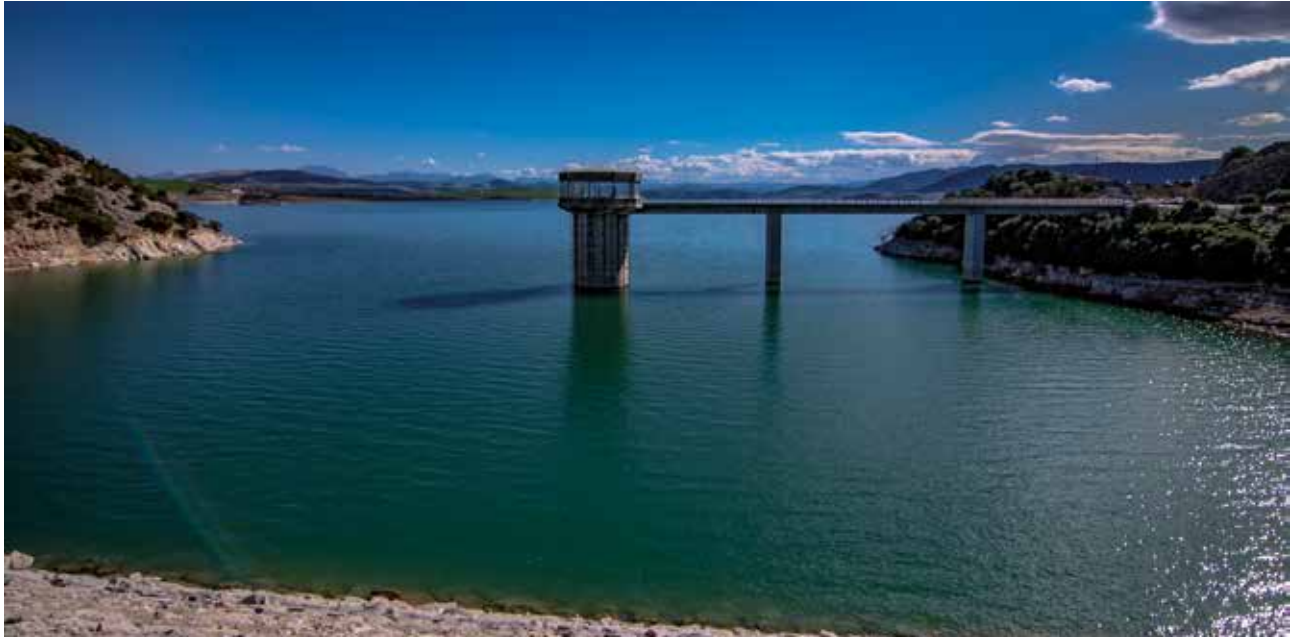
· Embalse de los Hurones ·