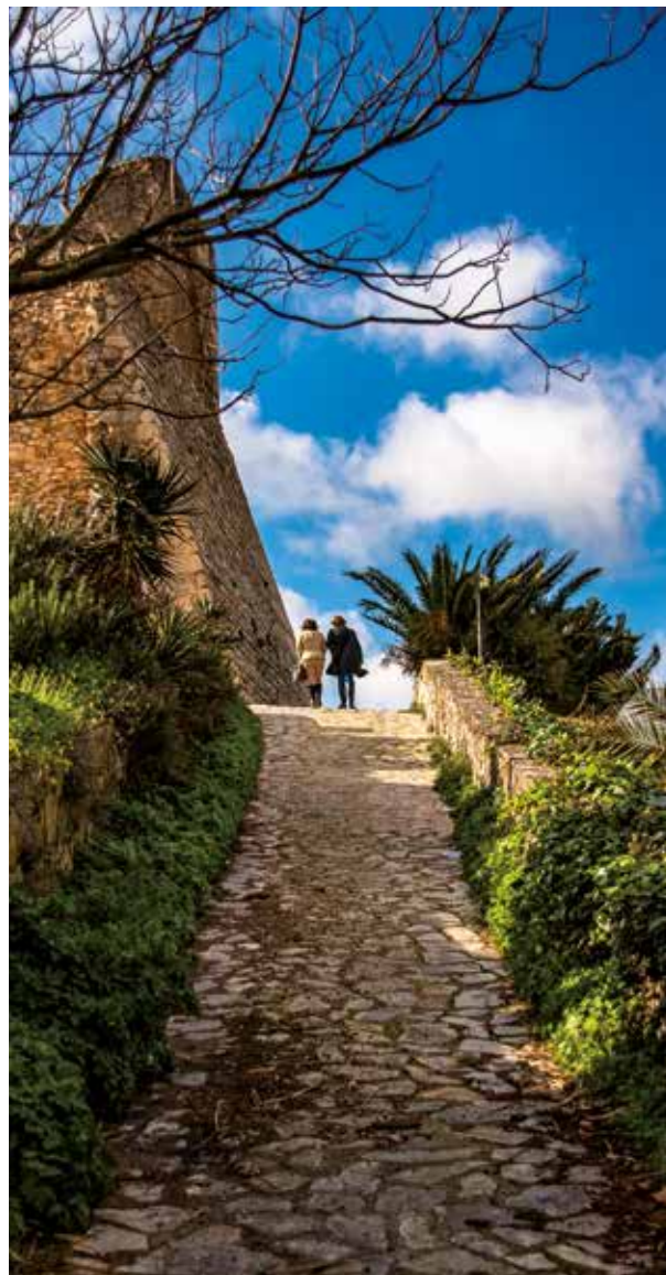
· Subida al castillo ·

Alejandro Sanz inauguró el 13 de abril de 2019, muy emocionado, la calle que lleva su nombre. El artista siempre ha