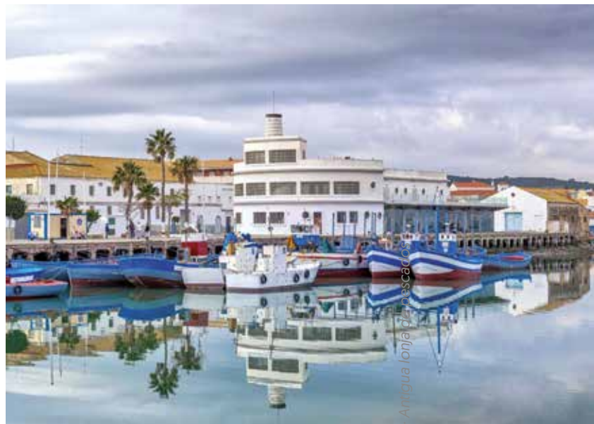
Antigua Lonja de Pescado

Junto a la desembocadura se encuentra uno de los edificios más bellos de nuestra localidad, que es la Antigua Lonja de Pescado . Construida por el arquitecto Casto Fernández Shaw, las obras de la Lonja Vieja se realizaron entre 1940 y 1943 en una época de prosperidad de la actividad pesquera y el desarrollo de la industria conservera y de salazones. Diseñó un edificio con la forma de la proa de un barco, varado en el río Barbate, compuesto por un cuerpo semicilíndrico y otro rectangular. En el edificio se observan guiños a la arquitectura náutica.