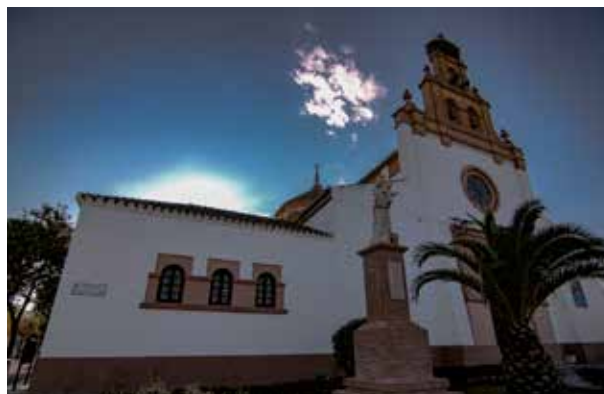
· Parroquia de San José del Valle ·