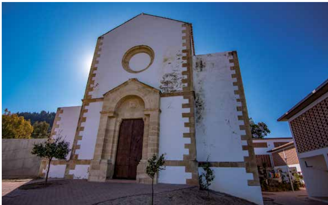
· Iglesia Vieja ·

unos seis kilómetros del pueblo se encuentra El Castillo de Gigonza, fortaleza medieval de estilo gótico-mudéjar del s. XII-XIII, uno de los monumentos mejor conservados de la zona y de mayor relevancia. Declarado bien de Interés Cultural. Fue construido por los musulmanes sobre un asentamiento de época romana. Es de propiedad privada, destinado a la explotación agropecuaria y vivienda particular. La visita al castillo está permitida, previa solicitud telefónica. Cerca del castillo se encuentran las RUINAS DE LOS BAÑOS DE GIGONZA, baños de aguas sulfurosas que gozaron de gran fama a finales del siglo XIX principios XX.