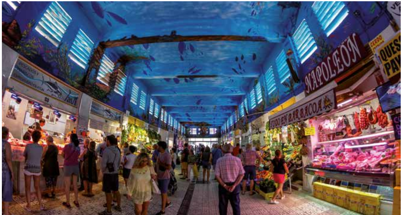
· Mercado de Abastos ·

Nuestra ruta termina en el Mercado de Abastos Andalucía, uno de los mercados más espectaculares de la provincia de Cádiz, construido en 1961 por Fernando de la Cuadra e Irizar, que actualmente es propiedad del ayuntamiento. En 2018 se pintó su techo, representando el copo de la almadraba, así como restos de un templo fenicio, arrecifes de coral y los atunes, dotándolo de un gran atractivo para sus visitantes. Además, no puede faltar la presencia de una escultura relativa a un atún, conocida como “Troncoatún” o “ÁrbolAtún”.