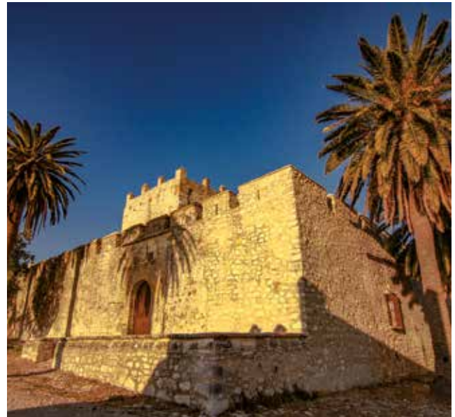
· Castillo de Gigonza ·

San José del Valle ofrece parajes naturales impresionantes, entre los que se ubican monumentos y edificios culturales que encierran los orígenes de este pueblo gaditano. A