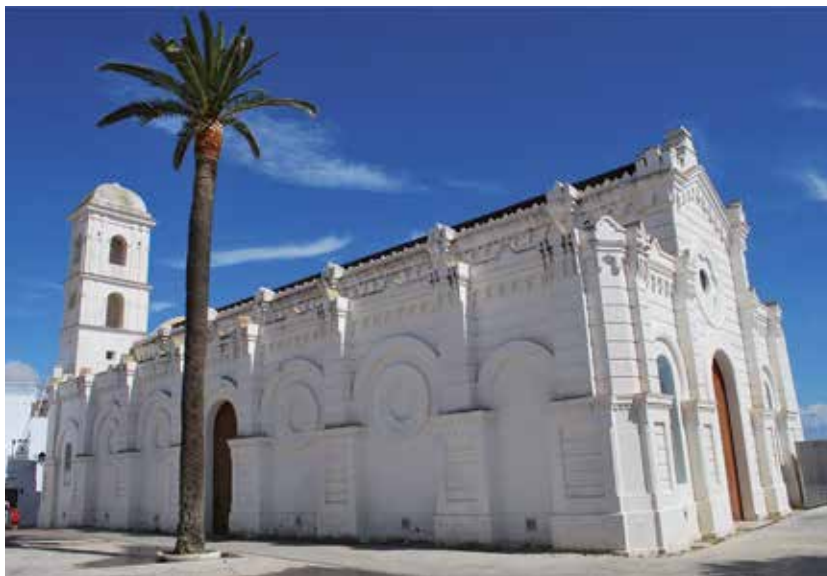
· Santa Catalina ·

12.- CENTRO CULTURAL SANTA CATALINA - Iglesia construida en el siglo XVI sobre restos de un edificio anterior. Fue restaurada a finales del siglo XIX con una intervención que supuso una mezcla de estilos arquitectónicos. Preside la plaza y jardines de su nombre; actualmente ha sido restaurada y tiene uso cultural.