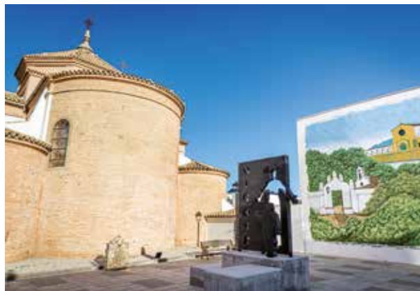
· Plaza Magone ·

En ella también podemos encontrar El Auditorio Juan Sánchez Gutiérrez se encuentra en pleno centro del municipio y, se convierte en un «nuevo espacio, un nuevo punto de encuentro social, cultural y vecinal», que responde a una necesidad que tenía San José del Valle , donde se demandaba un espacio de gran capacidad, que pueda acoger eventos de diversa índole y que sirva para dinamizar la actividad cultural y, por tanto, también, económica, comercial y turística del