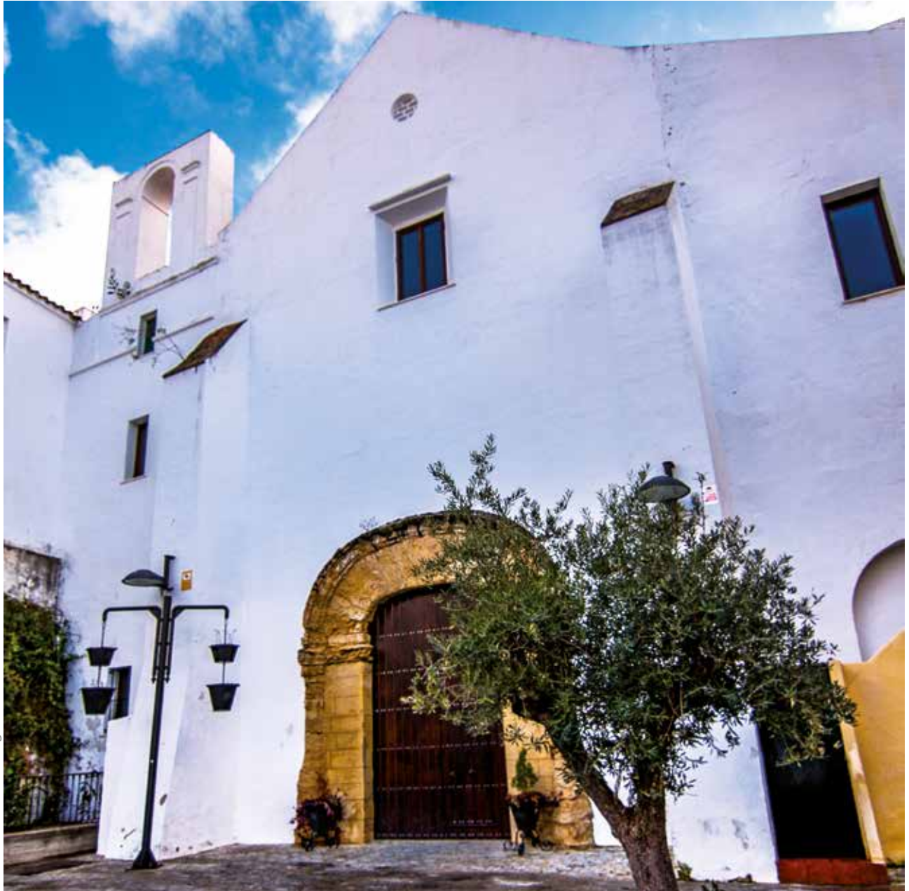
· Plaza de Santo Domingo ·