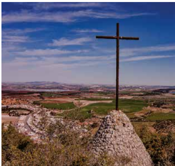
· Cruz del Valle ·

Otros detalles de la ruta del Monte de la Cruz San José del Valle La subida al Monte de la Cruz San José del Valle ofrece una de las mejores vistas al pueblo de San José del Valle, y también es un fantástico mirador a Arcos de la Frontera y otros lugares como Medina Sidonia y Paterna de La Rivera. La longitud de la ruta es de 5 kilómetros con un tiempo de recorrido de 3 horas aproximadamente. La dificultad del recorrido es baja, por lo que no hay que ser un profesional del senderismo para disfrutar de un maravilloso recorrido e increíbles vistas. Al sur del cerro, puede visualizarse el famoso monumento histórico Castillo de Gígonza y la vista de Medina de Sidonia.