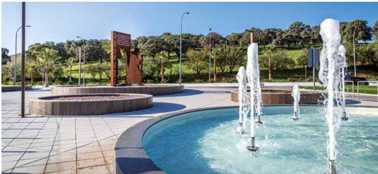
· Plaza de Juan Durán ·

municipio. En el lugar se encontraba el antiguo parvulario del pueblo, un edificio que se encontraba en desuso.