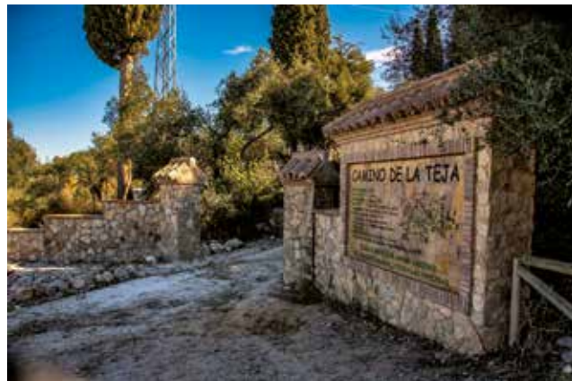
· Camino de la Teja ·