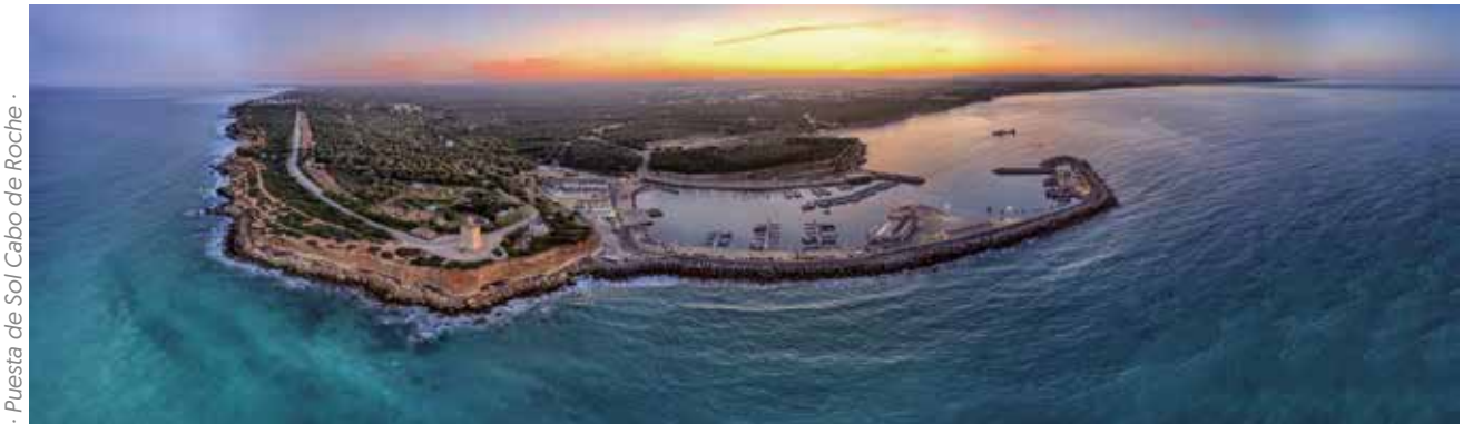
· Puerta de Sol Cabo de Roche ·

Otras alternativas de disfrute son nuestros parajes naturales como los senderos geolocalizados de las calas de Roche, calas de Conil, Conil Torre-Castilnovo y Río Roche.