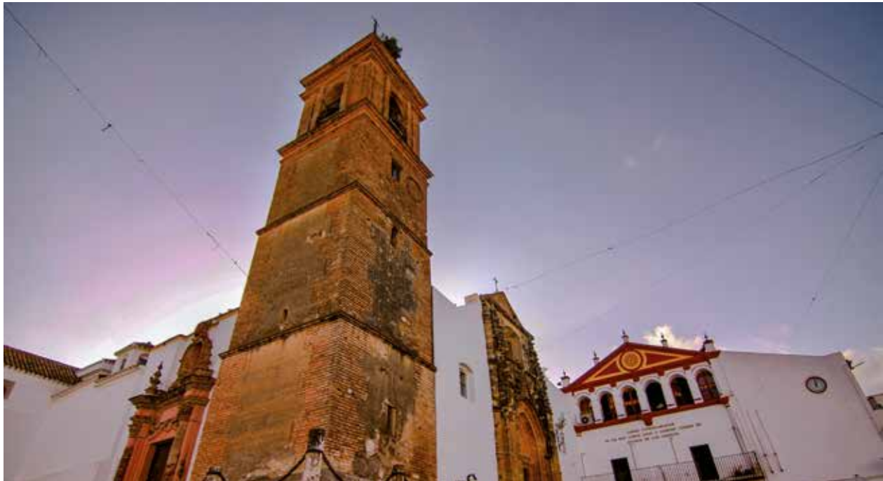
· Plaza Alta ·

Fue construida en la primera mitad del siglo XVI, sobre una mezquita musulmana. Es de estilo gótico tardío. Cuenta con trazado longitudinal y planta de cruz latina. La puerta principal se sitúa junto a la Casa Cabildo. En ella, la parte superior presume de un ventanal y justo debajo de este se observa el patrón de la localidad, San Jorge. Las columnas representan la ley del clero, si un ciudadano cometía un delito y las sobrepasaba, intervenía la justicia religiosa.