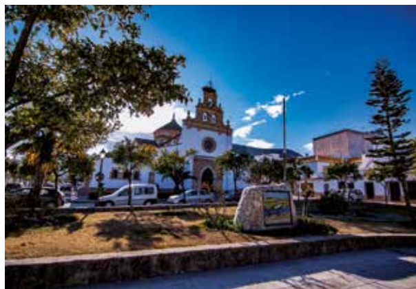
· Plaza de Andalucía ·