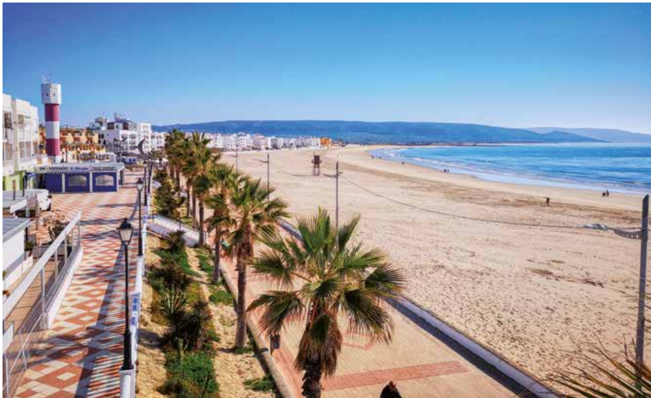
· Paseo Marítimo ·

La ruta que emprendemos nos lleva a conocer la historia del pueblo de Barbate, de tradición marinero por excelencia, conocido mundialmente por su almadraba, así como por su gastronomía y sus hermosas playas, además de por su parque natural, La Breña y Marismas del Barbate.